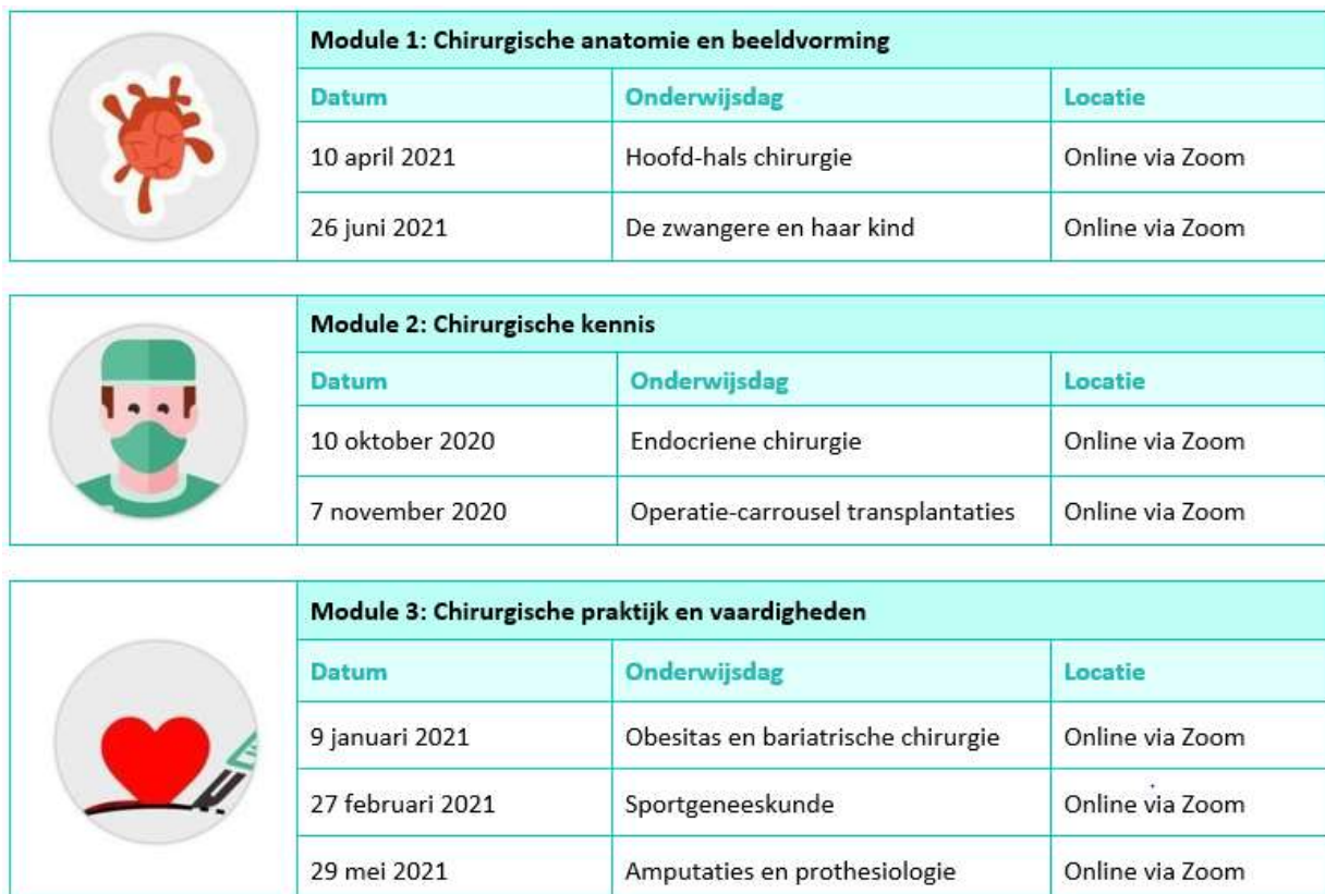
Figuur 3: jaarprogramma van de VCMS Master Academy 2020 – 2021

Hieronder (figuur 3 ziet u het jaarprogramma van de VCMS Master Academy. Bij aanvang van het jaar werd er initieel ingezet op zoveel mogelijk fysieke activiteiten te organiseren, echter hebben wij moeten uitwijken naar online alternatieven vanwege de COVID-19-pandemie. Bij iedere module is er opnieuw gekeken naar manieren om de dag toch een praktisch aspect te geven en hebben wij getracht om leden onderling ook samen te laten werken: zo zijn er workshops omtrent vaat- en darmanastomoses aanleggen georganiseerd, is er een live demonstratie van de anatomie van de onderste extremiteit op snijzaal geweest, is er in een discussiepanel uitgebreid gediscussieerd over de invloed van COVID-19 op amputaties en zijn er diverse keren patiënten als ervaringsdeskundigen aan het woord geweest. De Master Academy dagen zijn gemiddeld met een 7,9 beoordeeld (zie figuur 4 voor een uitwerking per Master Academy dag), een resultaat waar wij erg tevreden mee zijn.